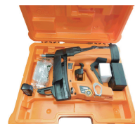
本体梱包イメージ