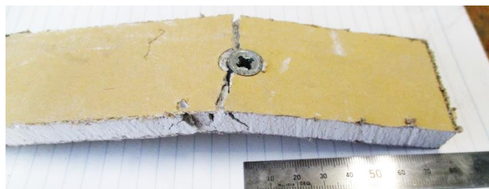
図 4 破壊形態例